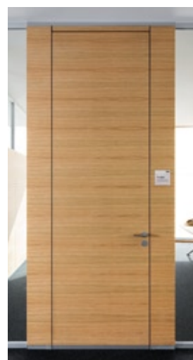
Holz-Türelement H70 flurbündig