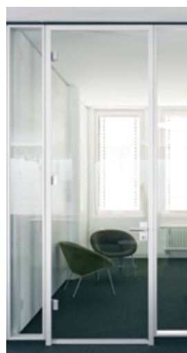
Glas-Türelement G10 raumhoch