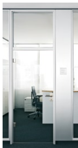
Glas-Türelement G10 mit Kämpferprofil und Oberlicht