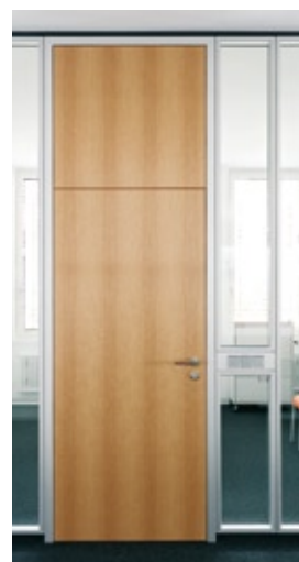
Holz-Türelement H60 flurbündig mit integrierter Oberblende